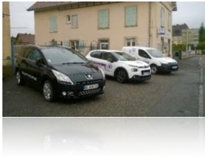
Notre flots de véhicules