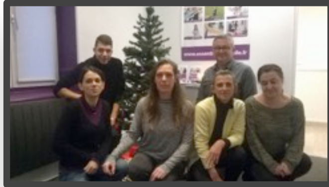
Notre équipe de janvier 2017